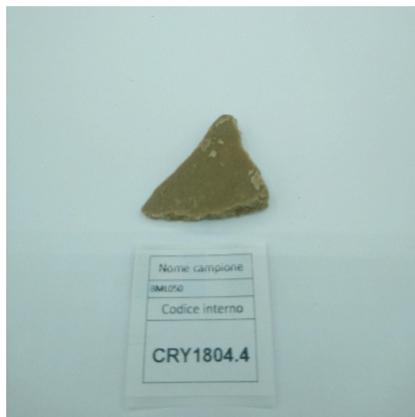
CAMPIONE ANALIZZATO: Finola(3.00gr)